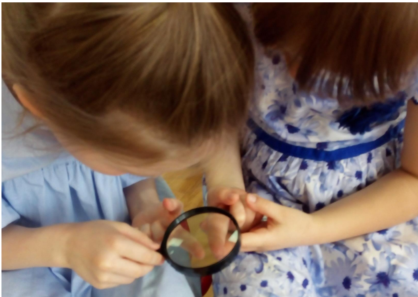
Рассматривание и сравнение рисунков на пальчиках.